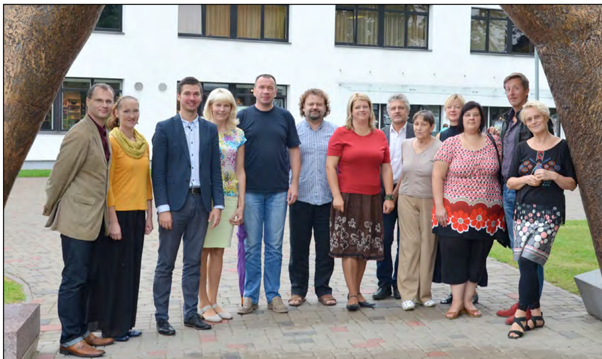
Mākslinieciskās pašdarbības kolektīvu vadītāji