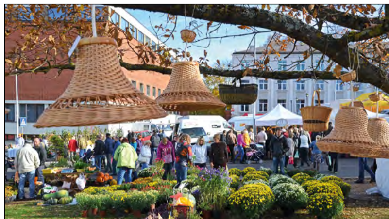
Simjūda gadatirgus 2013.gadā

Informācija par plašāko Ziemeļvidzemes gadatirgu – Simjūda tirgu