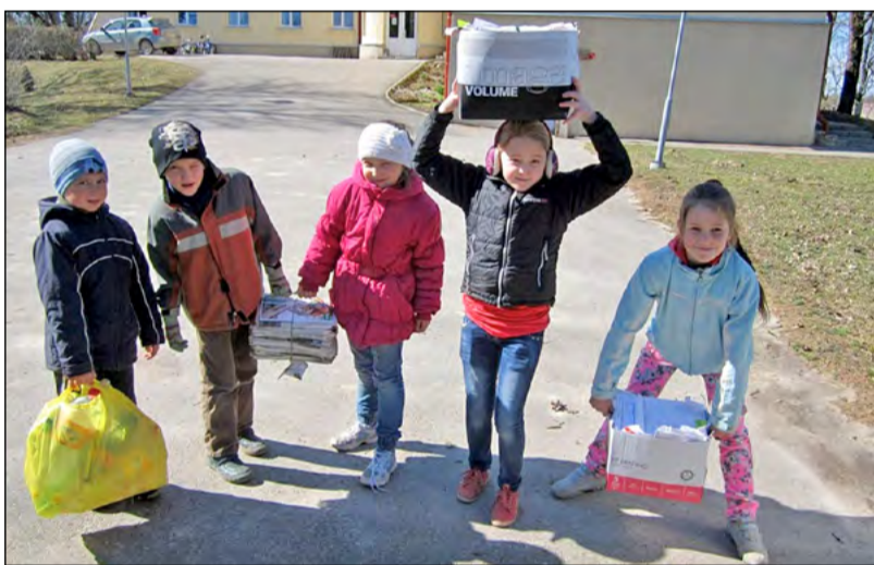
Jau 14. gadu skolēni aktīvi iesaistās ZAAO rīkotajos konkursos