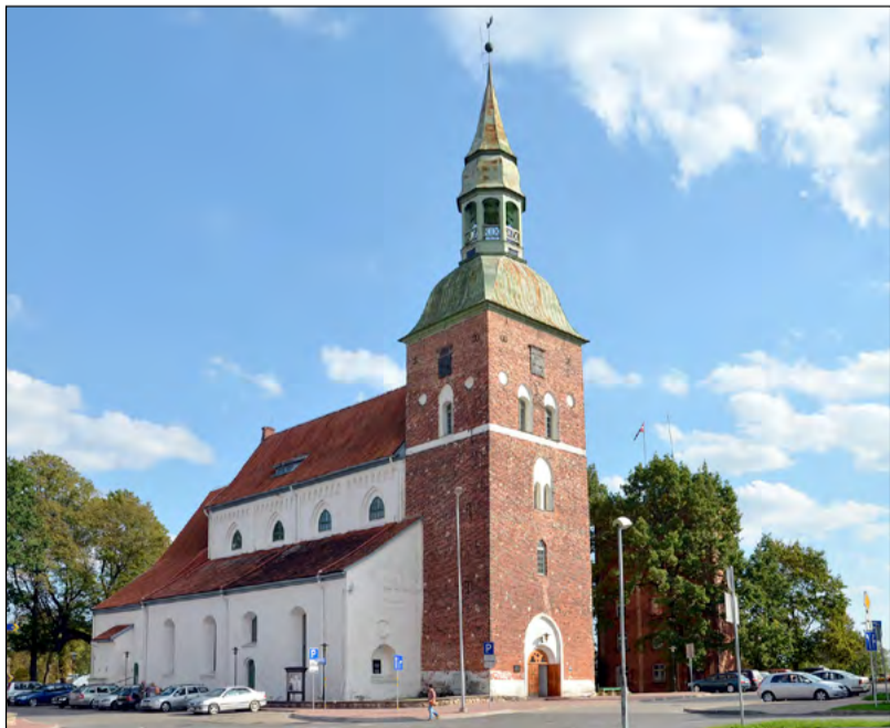
Pašreizējais Valmieras Sv. Sīmaņa baznīcas tornis ir celts 1739.gadā