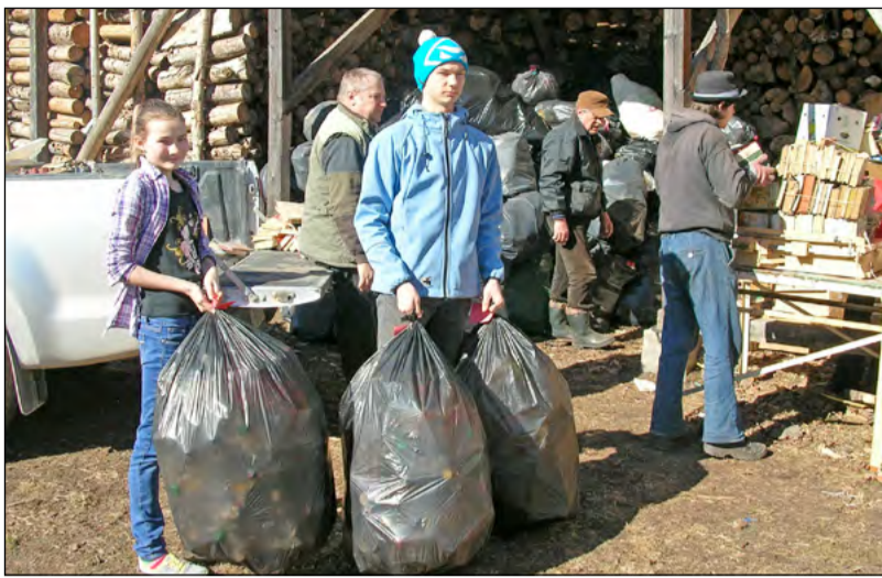
Skolēniem ir iespēja darboties piecos aizraujošos un interesantos konkursos

Projektam „Cilvēks vidē” šis būs jau 14. norises gads. Skolu audzēkņiem ir iespēja darboties piecos aizraujošos un interesantos konkursos: „ZAAO pastkarte”, „ZAAO mēneša jautājums”, otrreizējo materiālu vākšanas akcija, „Vides spēles” un jaunumā – skeču konkursā vidusskolām „Es iesaistots