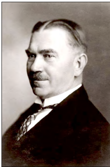
Bijušais Latvijas brīvvalsts premjers Arturs Alberings

Publisko lekciju par izcilo Latvijas agronomu, politiķi un sabiedrisko dar-