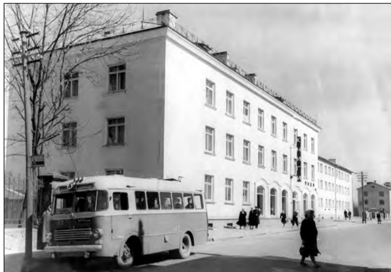
20. gadsimta 60. gadu sākuma foto no Valmieras muzeja krājumiem