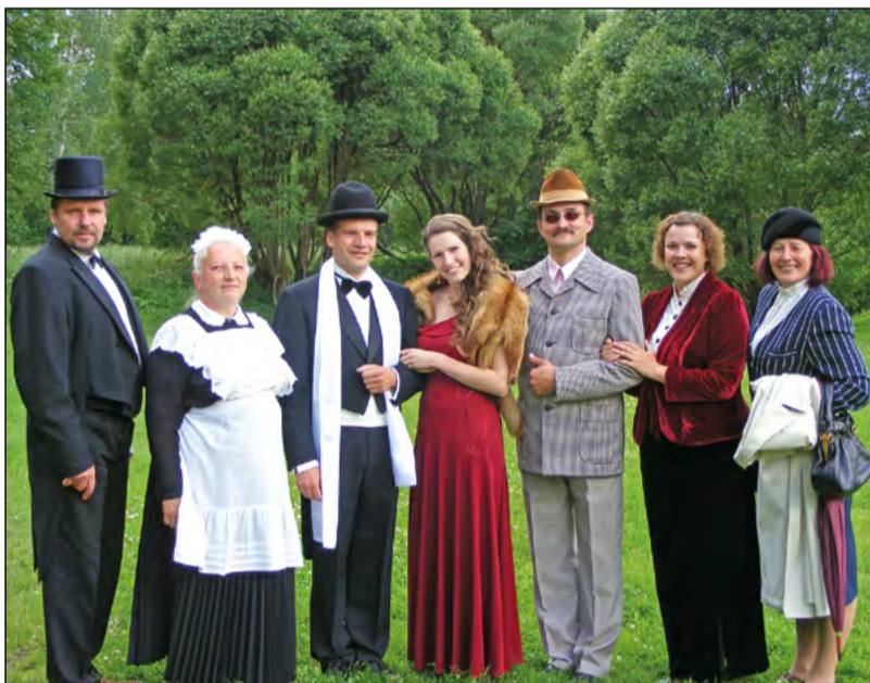
Rūjienas novada amatierteātris „Vitrāža”, komēdija – fars „Mans luteklītis”

Aicinām interesentus ņemt līdzi segas, uz kā apsēsties, jo vietu skaits pilsdrupu estrādē ir ierobežots. Lietus gadījumā izrādes notiks Valmieras Kultūras centrā. Ieeja bez maksas!