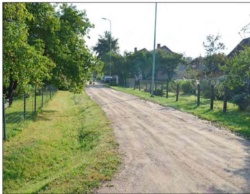
Ar putekļu absorbentu apstrādātā Senču iela

Kalcija hlorīds, ko izmanto ceļu apstrādei, nav kairinošs ādai un elpošanas ceļiem, tomēr var radīt nopietnu acu kairinājumu, ja tas tiešā veidā nonāk acīs. Vielai ir raksturīgs zems toksiskums. Lai izvairītos no acu kairinājuma, strādājot ar kalcija hlorīda šķīdumu darba vidē, ir jāievēro darba aizsardzības prasības. Uz ielām klātais materiāls samazina cilvēka veselībai radītos riskus, kas saistīti ar regulāru putekļu ieelpošanu. Materiāls, kas tiek izmantots grants ielu pretputekļu apstrādei, ir sertificēts, ar atļauju to lietot Latvijas teritorijā.