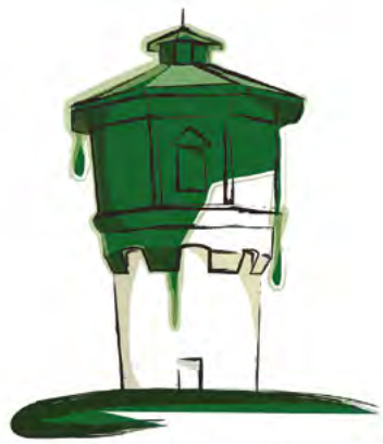
KĀRLIENAS PAGALMA SVĒTKI