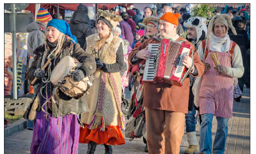
Budēļos iet no Mārtiņiem līdz Metējiem, bet visvairāk to dara Ziemassvētku laikā