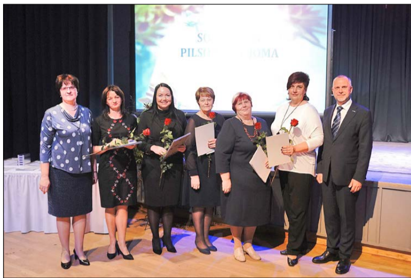
Lepojamies ar Valmieras zinošajiem un atsaucīgajiem pedagogiem!

Svinīgajā pasākumā tika godināti arī Valmieras pilsētas pašvaldības