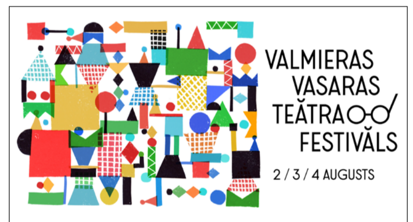
Valmieras vasaras teātra festivāla ilustrācijas autore Rūta Briede

Izrādes paredzētas visai ģimenei. Iestudējumu tematika būs “dzīvā pil-