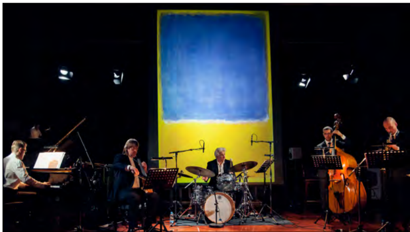
“Rothko in Jazz” koncertprogramma atspoguļo Marka Rotko darbu noskaņu

Bijetes: 10–15 EUR. Bijetes var iegādāties “Biješu paradīzē”. Ar Valmieras kultūras karti 15% atlaide; ar lietotni “Mana Valmiera” – 15% atlaide Valmieras pilsētā deklarētajiem iedzīvotājiem. Koncerts notiek Mākslas dienu laikā.