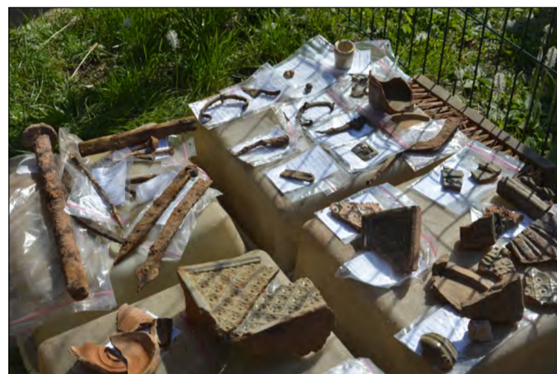
Pieejams pārskats par Valmieras pils arheoloģisko izpēti

Izpētes procesā tika atrastas dažādas vēstures liecības – būvkeramika, pils jumtu kārneņi, krāsns podiņi, jātnieka piesis, svečturis, šaujamočca mēlīte, naži, zāģis, ilens, baltmāla pipes, svina lodes, fajansa trauciņš zālēm vai dārgām garšvielām, apavu apkalumi, zirglietas, atslēgas, monētas, zīmodziņš, aproce, sprādze, saktas, dzīvnieku kauli, māla, akmens masas, porcelāna un stikla lauskas un