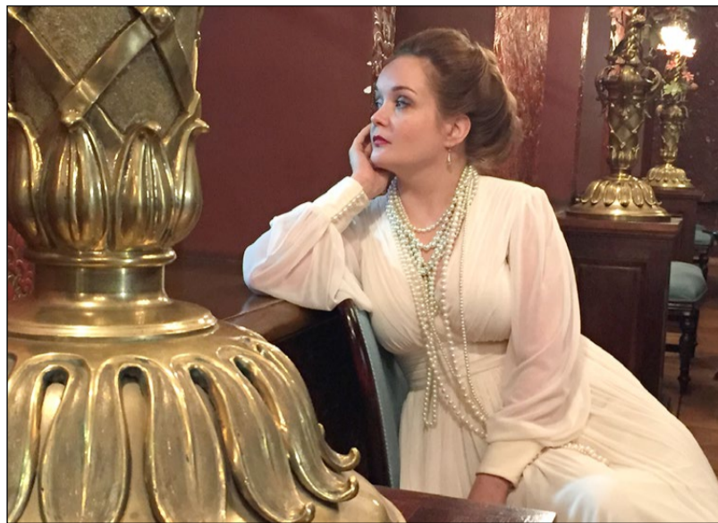
Aicinām apmeklēt koncertu - mīlasstāstu starp latviešu glezniecības klasiķi Jani Rozentālu un somu dziedātāju Elliju Forseli

Koncertu organizē Valmieras Kultūras centrs sadarbībā ar VSIA "Latvijas Koncerti". Pasākums notiek "Mākslas dienas 2018" ietvaros.